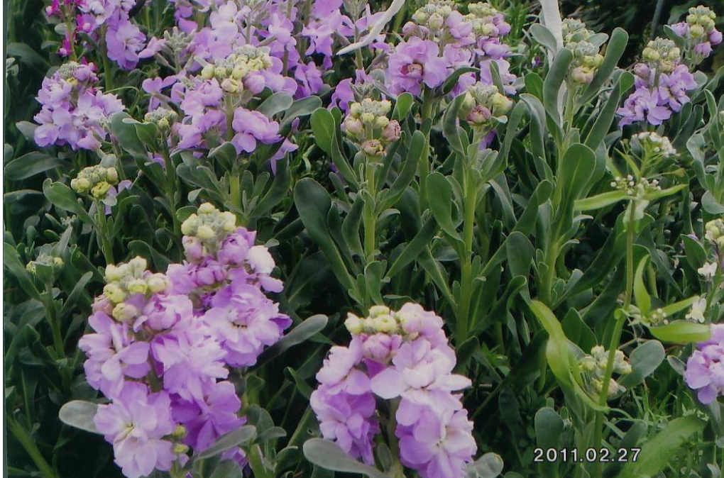
千倉の花畑 (ストック)