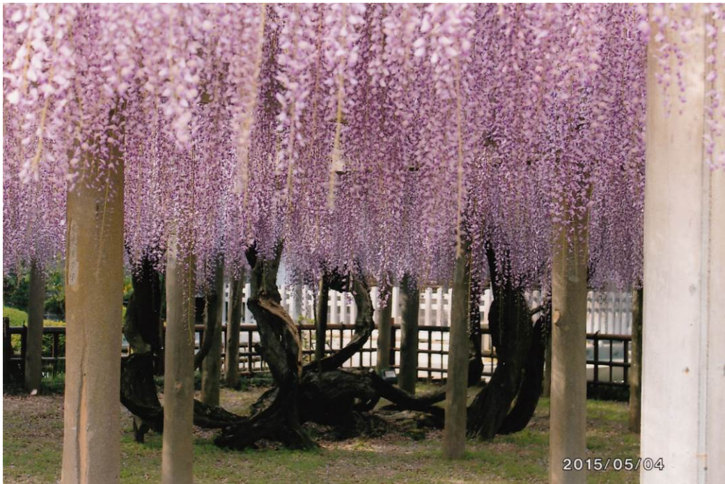
臥龍の藤 (妙福寺) (2)