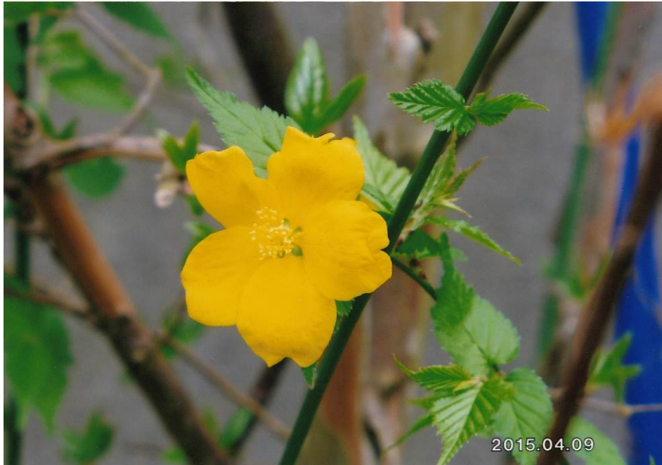
山吹 提供：宮内 宗一 会員 (18)