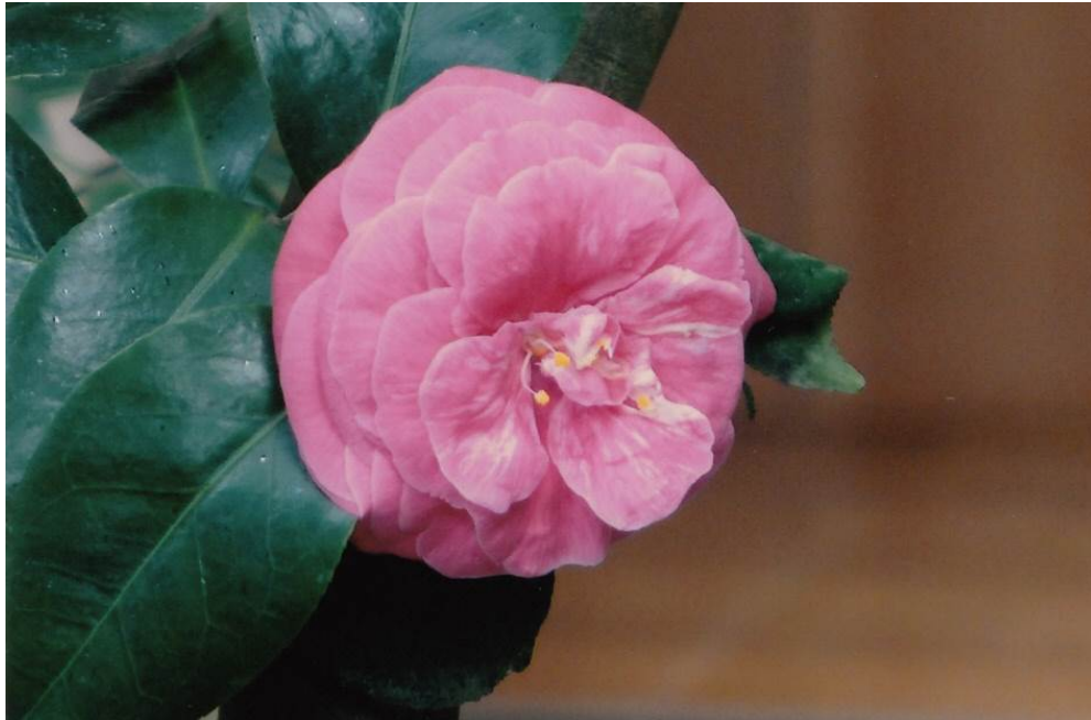
椿 (17)