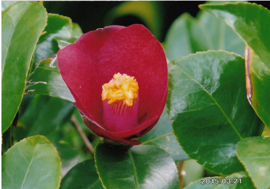
佐助 (椿) 提供: 宮内 宗一 会員 (16)