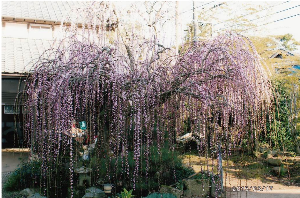
しだれ梅 (1)