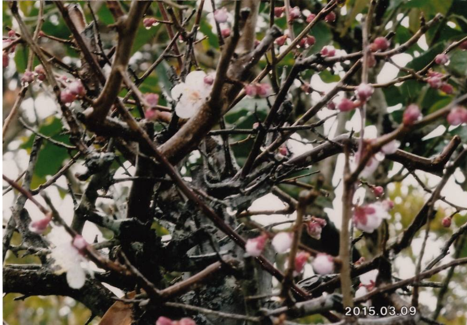
梅の花 提供：宮内 宗一 会員 (15)