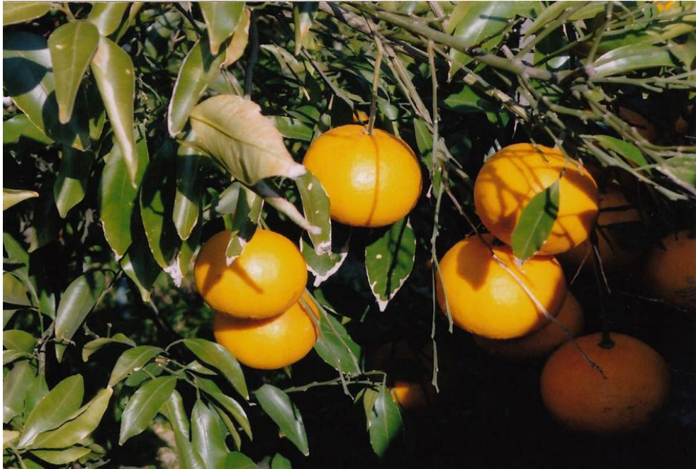
夏みかん (14)