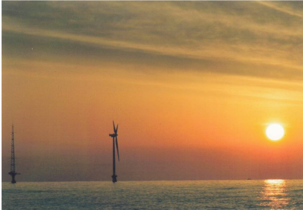
風車と夕日 (8)