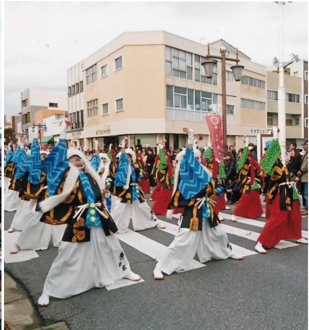
黒潮よさこい祭り 提供：宮内 宗一 会員 (12)