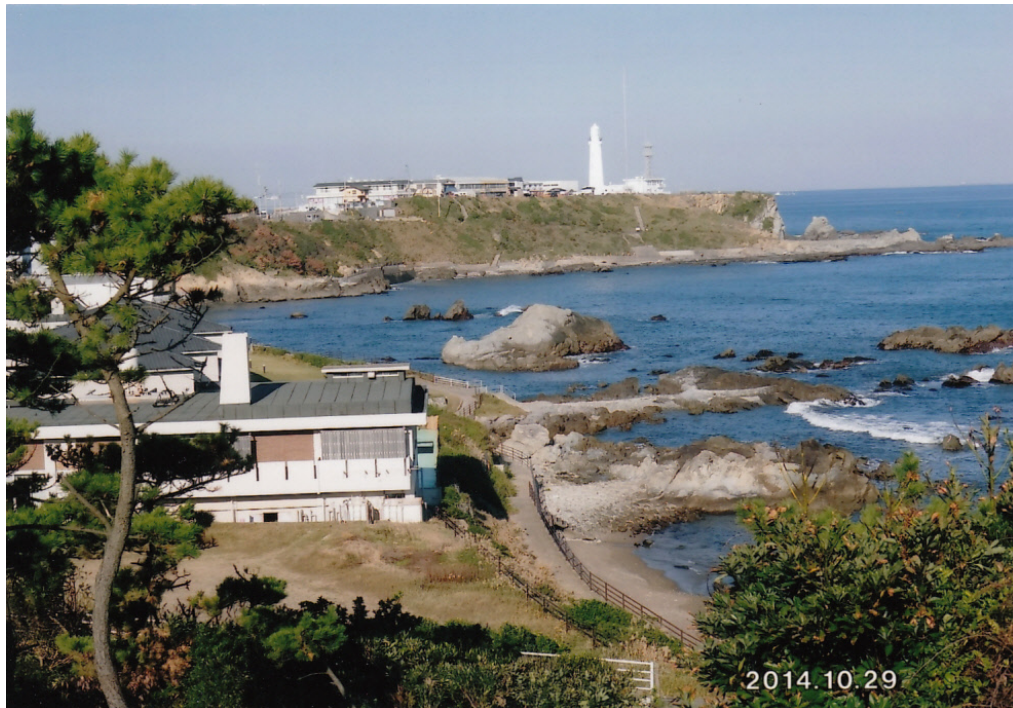
犬吠埼 (3)