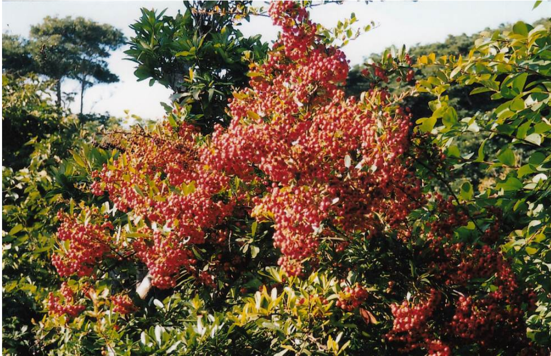
宮内家の庭の木 (10)