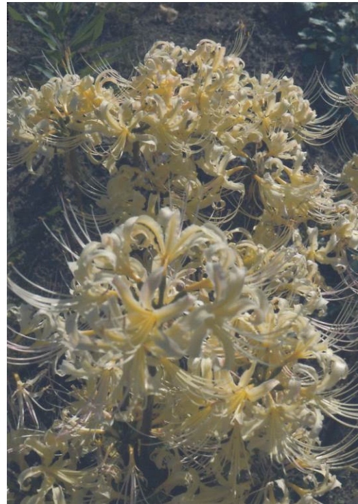
彼岸花 (4)