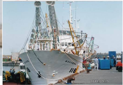
秋刀魚漁（銚子漁港）（7）