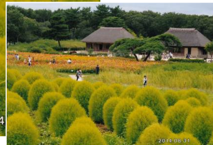
コキアと古民家 (約 350 年前の茅葺古民家を移築・復元) (ひたち海浜公園) (6)