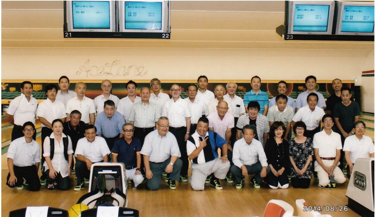
銚子・銚子東RC合同スポーツ大会