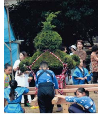
三崎町大宮神社 「祇園祭」に登場した7年に1度の杉神輿