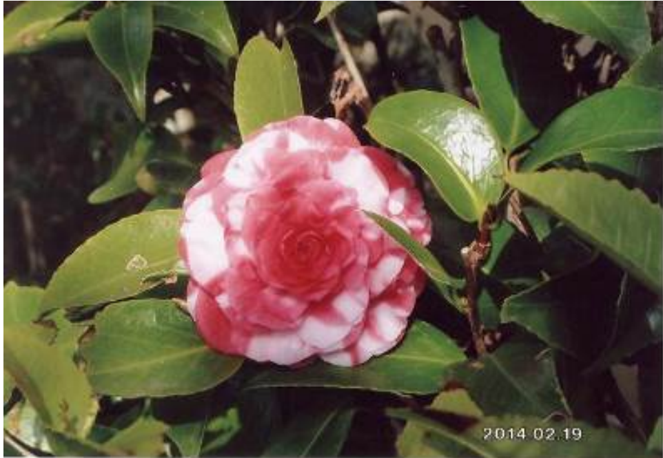
庭の椿 (12)