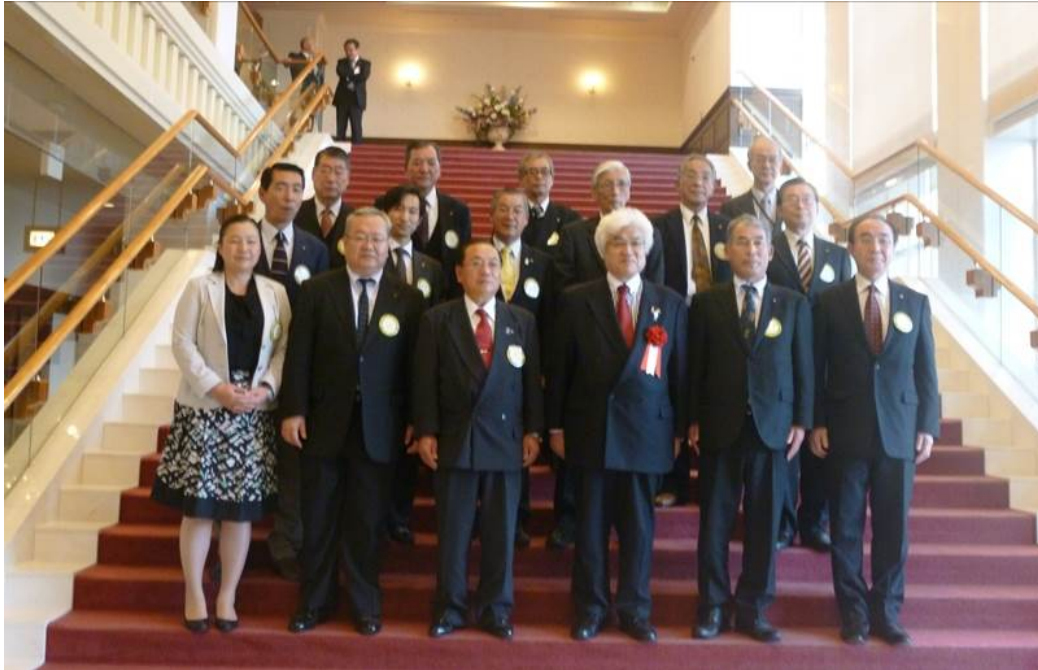
第7分区インターシティー・ミーティング