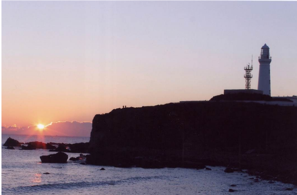
犬吠埼灯台 (3)