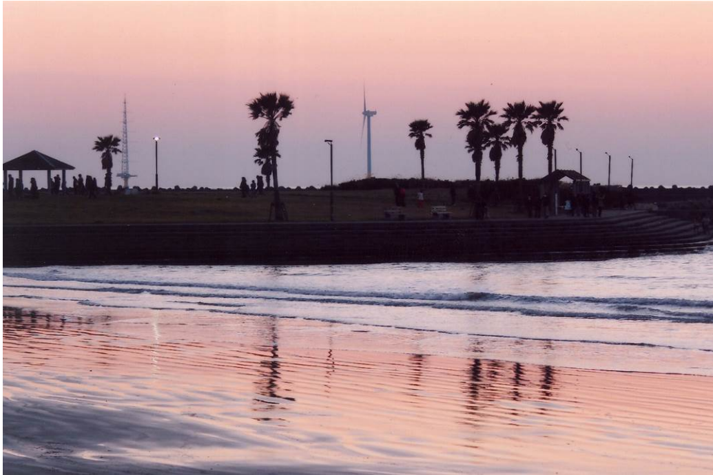
銚子マリーナ 提供：宮川 雅夫 会員 (2)