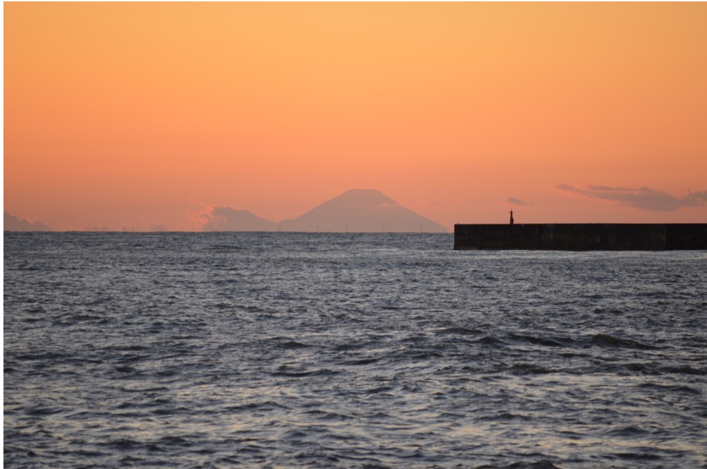
外川漁港からの富士山 (9)