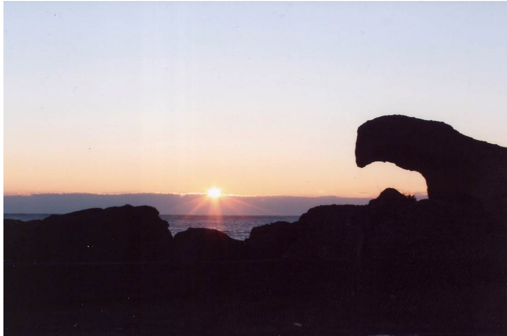
初日の出ととんび岩（黒生町）（1）