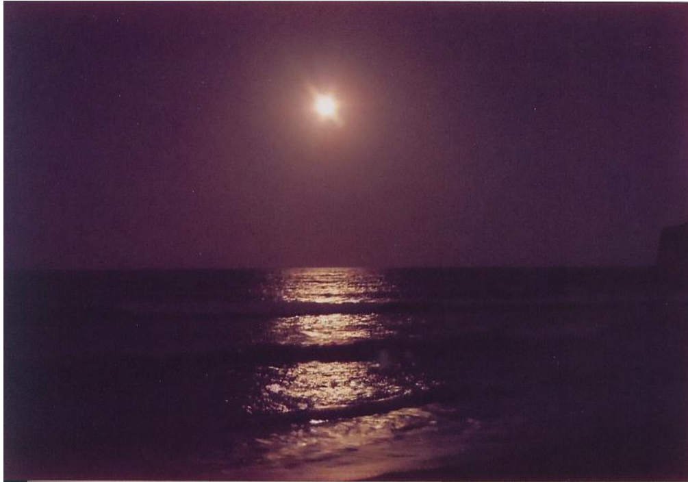
月の階段 (10)