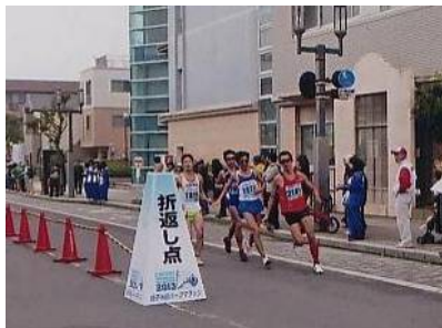
11月3日（日・祝）銚子半島ハーフマラソン