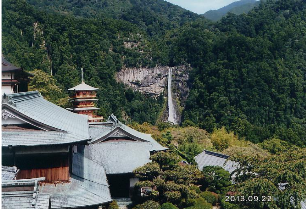
青岸渡寺（塔）と那智の瀧（和歌山県）