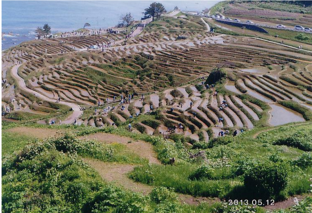
輪島の白米千枚田 (1)