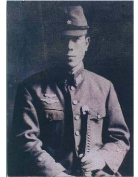
レイテで特攻散華した上野哲彌少尉

会いをテーマとした映像作品が「翔天の詩」です。作品の中の航空将校を戦後、追跡調査をしました。その結果、将校が山形県酒田市出身で陸士 57 期の上野哲彌少尉であることを突き止めました。上野少尉は昭和 19 年 11 月、陸軍特攻八紘石腸（はっこうせきちょう）隊々員として春日台の飛行場、正確には下志津陸軍飛行学校銚子分教場から出陣、昭和 20 年 1 月 8 日フィリピンの最前基地から出撃し、レイテ湾の敵空母に突入戦死したことも分かりました。