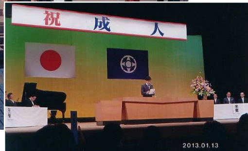
銚子市成人式 (1月13日)