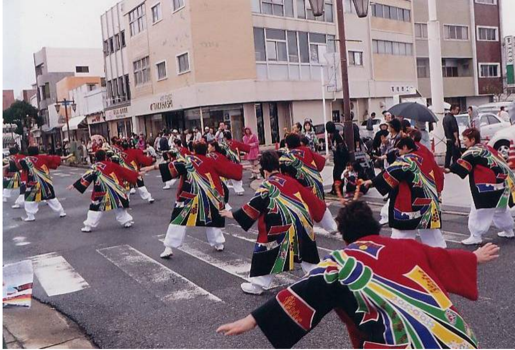
黒潮よさこい祭り (11)