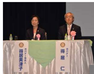
得居ガバナー 御夫妻