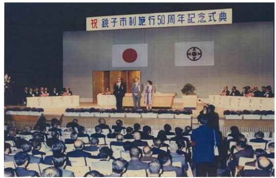
銚子市制施行 50 周年記念式典 昭和 58 年 2 月 10 日

協定して既に 30 年近く経ちますが、現在でも民間レベルで交流は続いております。事務局として、商工会議所の中に「銚子市・コースベイ市姉妹都市友好委員会」があります。