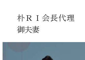
朴 R I 会長代理 御夫妻