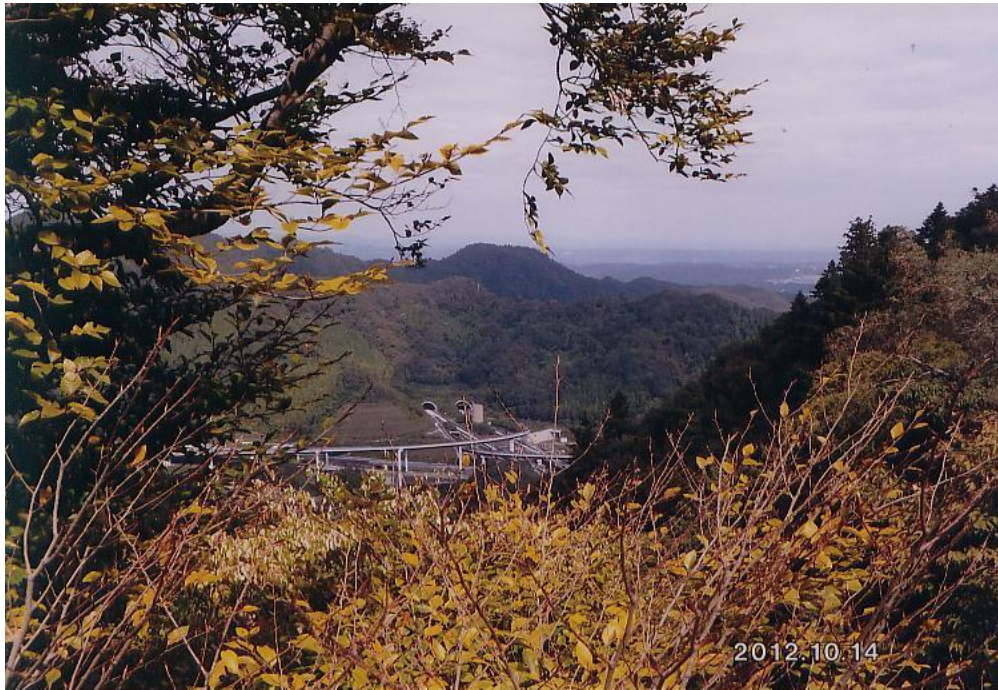
高尾山 (10)