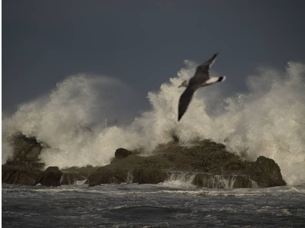
黒生海岸のカモメ (4)