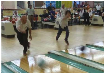
両クラブ会長の始球式