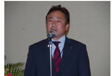
恒例の「手に手つないで」