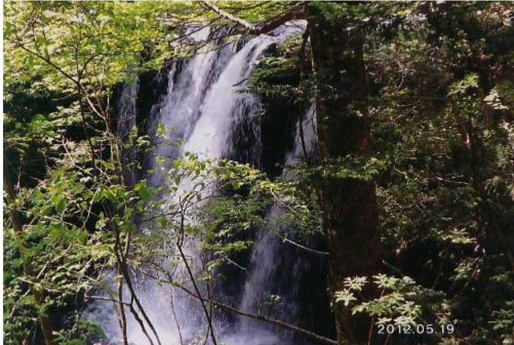
乙女の滝 (栃木県那須塩原市)