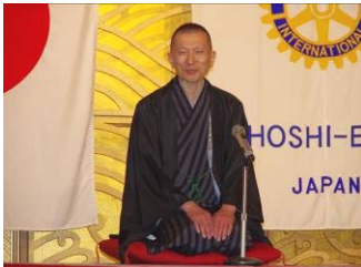
記念講演・寄席 三遊亭竜楽師匠