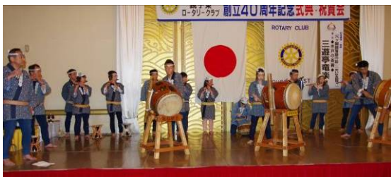
愛宕獅子による鳴り物