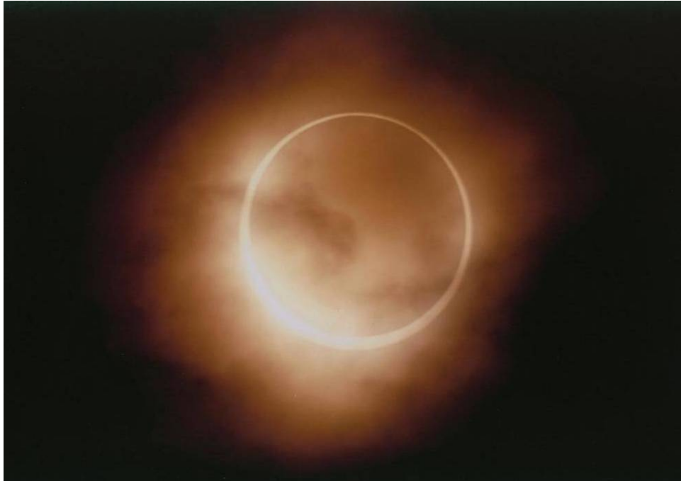
金環日食 (5月21日)