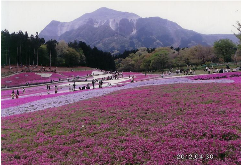
芝桜と武甲山（秩父市・羊山公園）