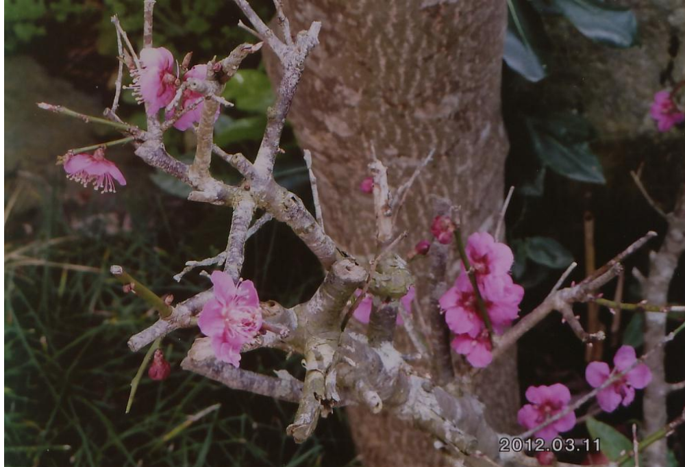
宮内家の梅