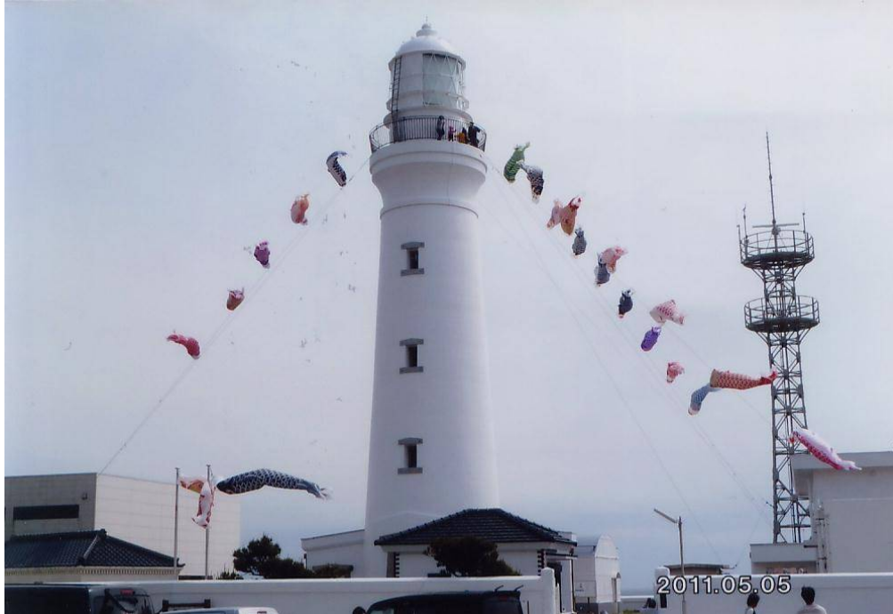
犬吠埼灯台