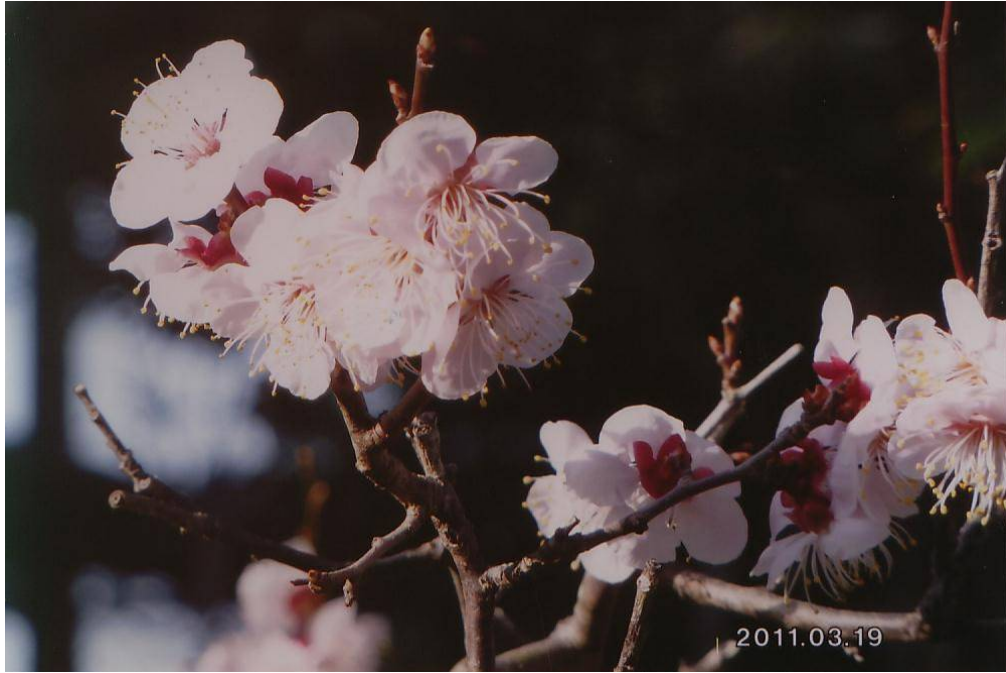
宮内家の梅