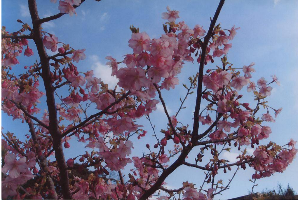
河津桜（銚子市前宿町）