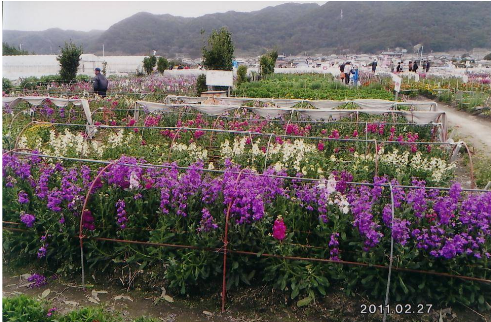
千倉の花畑