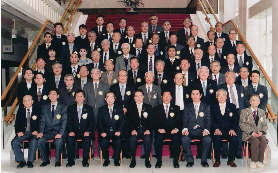
2010-11 年度第7分区インターシティー・ミーティング