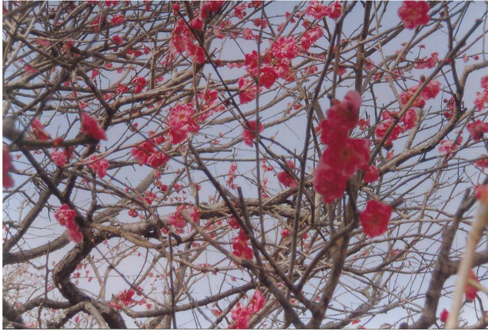
浄国寺の梅