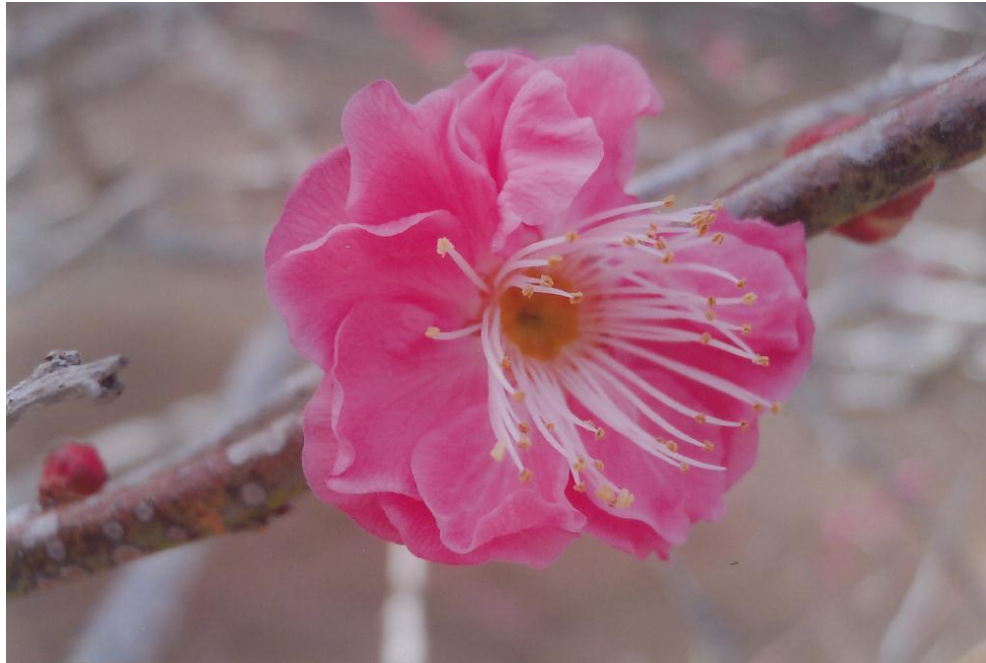
浄国寺の梅