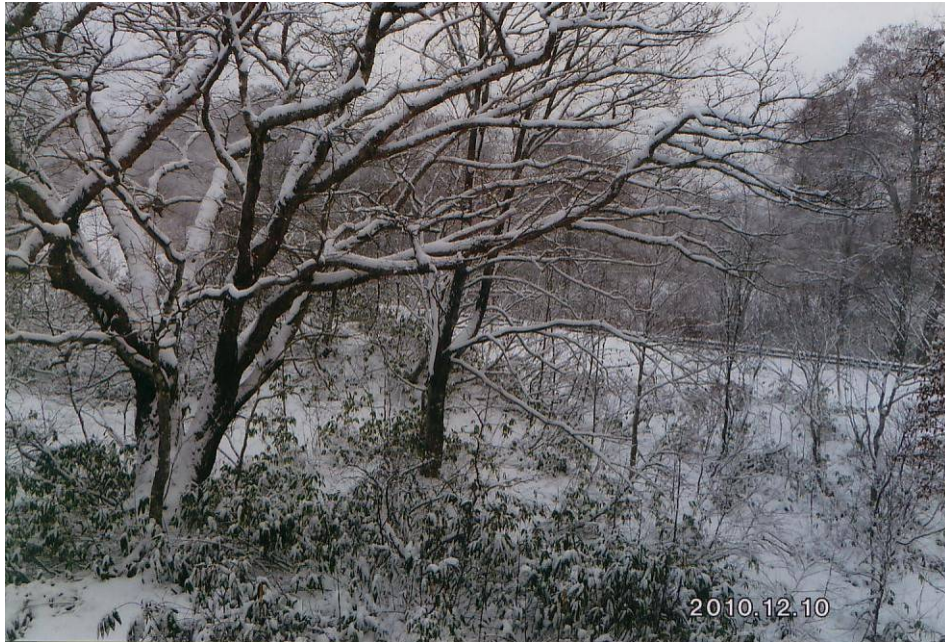
乳頭温泉郷 (秋田県)