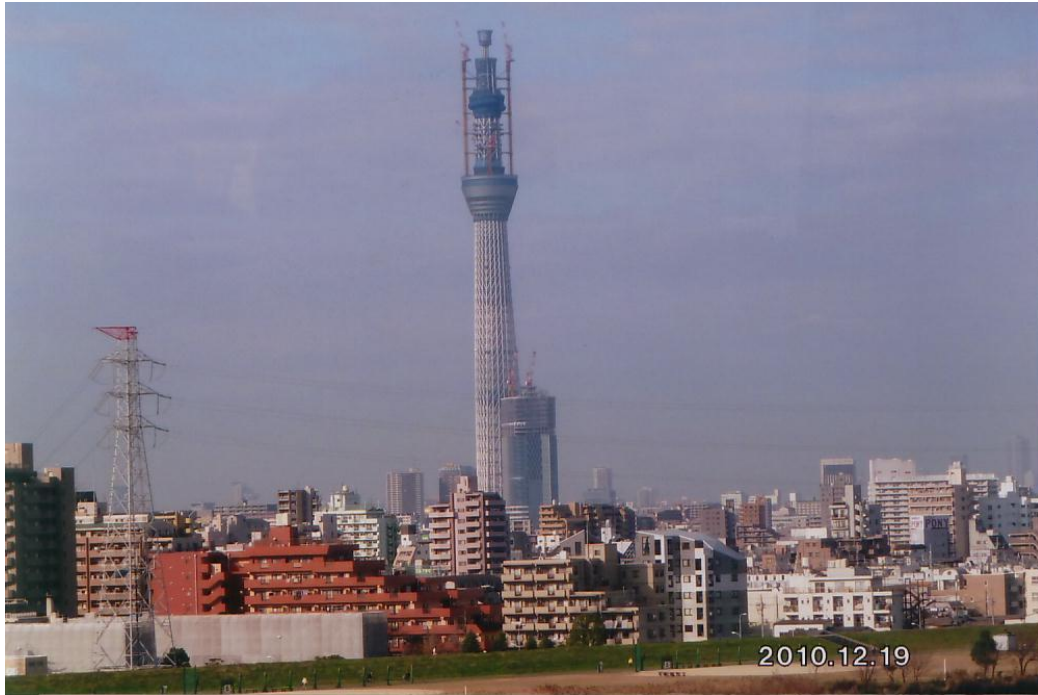
スカイツリー