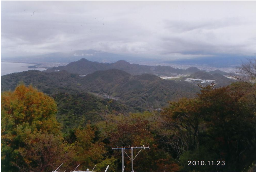
伊豆（ロープウェイから見た景色）