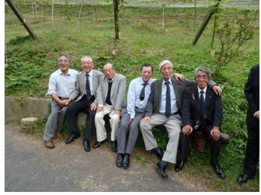
斜度38度のブドウ畑