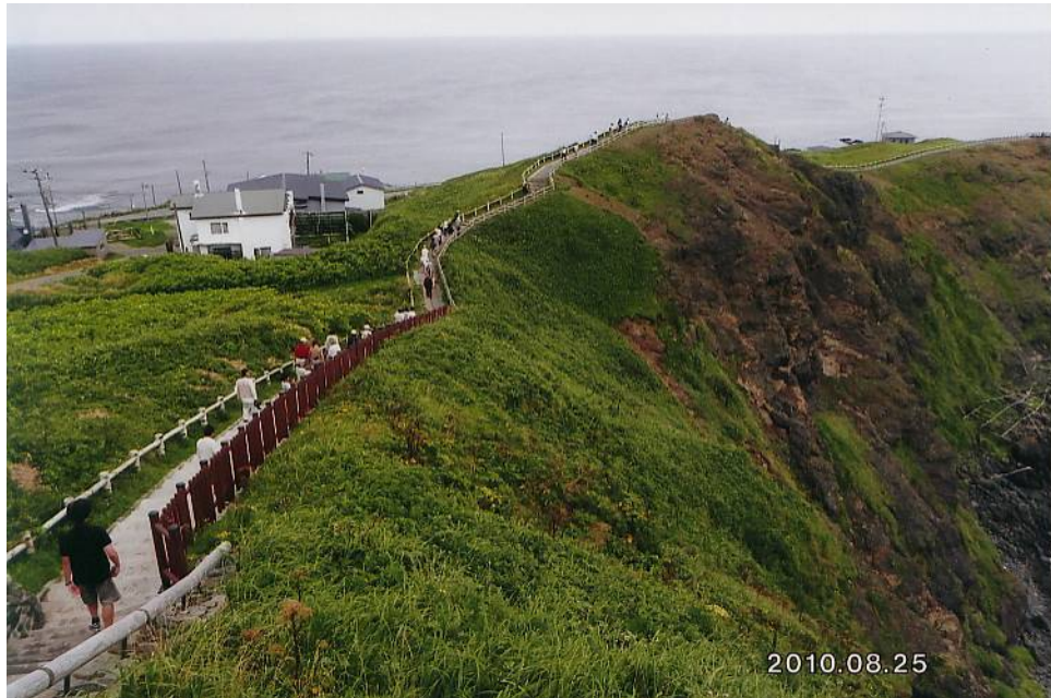
襟裳岬（北海道）